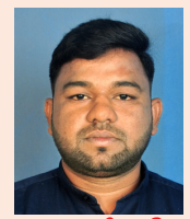
- వినుగుల వేలంగిని,