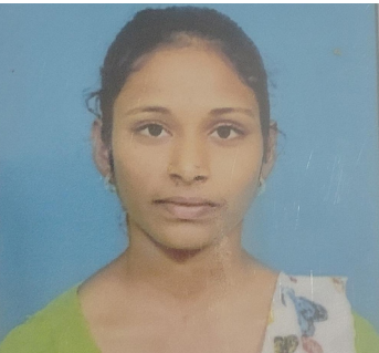
కె.సామ్యు (475/500), Mphw(f)-first year