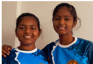
జాతీయ స్థాయి క్రీడా పోటీలకు తోర్రారు విద్యార్థులు