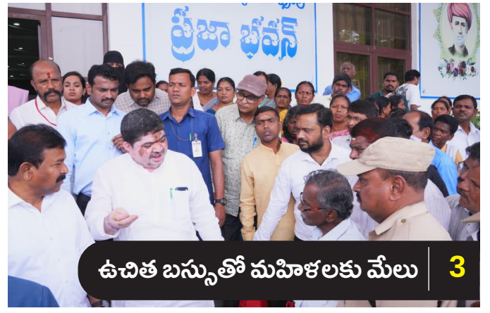
ఉచిత బస్సుతో మహిళలకు మేలు 3

సంపుటి : 01 | సంచిక : 124 | ఎడిటర్ : ఉప్పలంచి నరేందర్ | బుధవారం, 01 ఏప్రిల్ 2026 | పేజీలు : 4