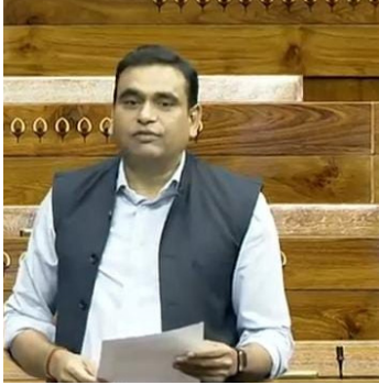
ప్రభుత్వం ఇచ్చిన సమాధానంలో క్రీడలు రాష్ట్ర అంశం కావడంతో మౌలిక సదుపాయాల అభి

జనగామ, మన చౌరాస్తా : తెలంగాణ రాష్ట్రానికి చెందిన లోక్ సభ సభ్యుడు చామల కిరణ్ కుమార్ రెడ్డి రాష్ట్ర ప్రభుత్వం, కేంద్ర యువజన వ్యవహారాలు, క్రీడల మంత్రిత్వ శాఖకు పంపిన క్రీడా మౌలిక సదుపాయాల అభివృద్ధి ప్రతిపాదనలపై సోమవారం పార్లమెంట్ లో మాట్లాడారు. ఈ ప్రతిపాదనల్లో గచ్చిబౌలిలోని జీఎంసీ బాలయోగి అడ్డటిక్స్ స్టేడియం అప్ గ్రేడ్ చేసి, హైదరాబాద్ విశ్వవిద్యాలయం ప్రాంగణంలో ఘాటింగ్ రేంజ్ ఏర్పాటు, అలాగే రాష్ట్రంలో స్పోర్ట్స్ హాల్, స్పోర్ట్స్ యూనివర్సిటీ స్థాపనకు కేంద్ర ఆర్థిక సాయం అందించాలని కోరారు. అయితే కేంద్ర