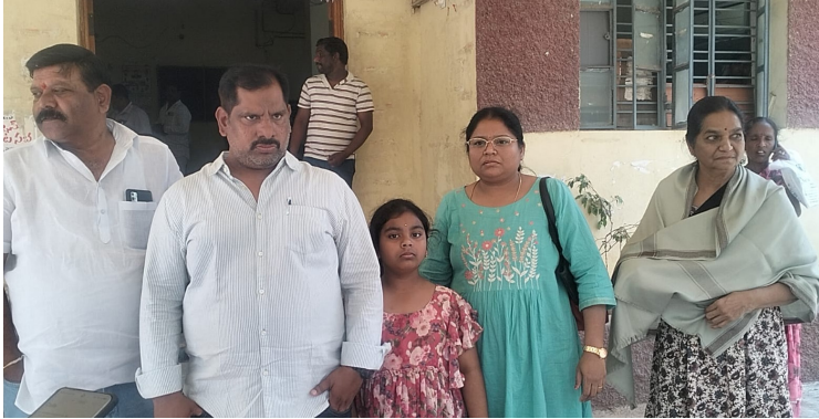
జనగామ, మన చౌరాస్తా :

జనగామలో నిర్విఘ్న మెడికల్ కాలేజీ భూ వివాదం.. కాస్తా ఆర్టివో కార్యాలయానికి చుట్టుకుంది. గడువులోగా భూనిర్వాసితులకు పరిహారం ఇవ్వకపోవడంలో ఆర్టివో కార్యాలయంలోని వస్తువుల జప్తును కోర్టు ఆదేశాలు ఇచ్చింది. దీంతో బాధితులు, కోర్టు అధికారులు సోమవారం ఆర్టివో కార్యాలయ వస్తువులను జప్తు చేసేందుకు రావడంతో కార్యాలయంలో కొంత గందరగోళం నెలకొంది.