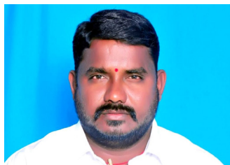
లోటస్ హాస్పిటల్ పై

ఇక గవర్నమెంట్ హాస్పిటల్ కు వచ్చే పిల్లలు, డెలివరీ కోసం వచ్చే మహిళలను దళారుల మద్దతుతో వారి సొంత ఆసుపత్రికి రప్పించుకుంటూ అధిక ఫీజులు వసూలు చేస్తూ డబ్బులు దండుకుంటున్నారనే ప్రచారం జరుగుతోంది. అసలు వీరు గవర్నమెంట్ ఉద్యోగం చేస్తున్నారా..? లేదా వారి హాస్పిటల్ నడుపడం కోసమే గవర్నమెంట్ ఉద్యోగం చేస్తున్నారా..? వీరు గవర్నమెంట్ హాస్పిటల్ లో విధులకు హాజరు అవుతున్నారా? లేదా.. ఆ పేరు చెప్పుకుని ప్రైవేట్ లో పని చేస్తున్నారా? వీరిపై సమగ్ర విచారణ జరిపించాలని సోమవారం జరిగిన గ్రీవెన్స్ లో ఫిర్యాదు చేశారు.