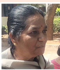
-చెంచారపు శోభ, బాధితురాలు

మా భూమి తీసుకున్నారు. కానీ ప్రభుత్వం ఎలాంటి పరిహారం ఇవ్వలేదు. 40 ఏళ్లుగా కోర్టుల చుట్టూ తిరుగుతున్నా.. న్యాయం జరుగడం లేదు. ఇప్పటికైనా ప్రభుత్వం, అధికారులు కనికరించి మాకు న్యాయం చేయాలి. మాకు రావాల్సిన పరిహారం అందించాలి.