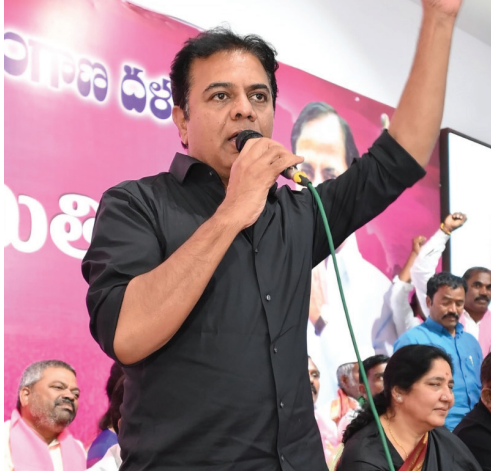
కేటీఆర్ పై కేసు

2001లోనే హైదరాబాద్ లో ఫార్ములా 1 రేస్ పెట్టాలని అప్పటి చంద్ర బాబు ప్రభుత్వం ప్రయత్నించినది కేటీఆర్ తెలిపారు. కానీ మారిన రాజకీయ పరిణామాలతో బీఆర్ఎస్ ప్రభుత్వం హైదరాబాద్ లో ఫార్ములా ఈ కార్ రేస్ నిర్వహించామని అన్నారు. ఈ అంశంపై చర్చించేందుకు శాసనసభలో అనుమతించాలని స్పీకర్ ను కోరామన్నారు. ఫార్ములా ఈ కార్ అంశంపై చర్చించే సత్తా ప్రభుత్వానికి లేదని ఎద్దేవా చేశారు. అక్రమాలు నిరూపించకుండా లీకులిస్తూ ఆరోపణలు చేస్తూ తప్పుడు కేసు పెడుతున్నారని కేటీఆర్ ధ్వజమెత్తారు. హైదరాబాద్ లో ఈ కార్ రేసింగ్ నిర్వహించడంపై సచిన్, ఆనంద్ మహీంద్రా వంటి ప్రముఖులతో పాటు బీజేపీ కేంద్ర మంత్రులు ప్రశంసించారని కేటీఆర్ గుర్తు చేశారు. కారు రేస్ నిర్వాహకులకు హెచ్ఎంఓ రూ. 55 కోట్లు చెల్లించినది వెల్లడించిన కేటీఆర్, ఇది వాస్తవమని నిర్వాహకులు అంగీకరిస్తున్నారని, ఇందులో అవినీతి జరిగింది ఎక్కడో వివరణ ఇవ్వాలన్నారు. రేసింగ్ రద్దయినందున లైసెన్స్ ఫీజు రూ. 74 లక్షలు వాపస్ తీసుకోవాలని ఎంఫెంఎంఎస్ వి మాట్లాడేలా రాసినా ప్రభుత్వం స్పందించడం లేదని కేటీఆర్ పేర్కొన్నారు. ఫార్ములా ఈ కార్ రేసు కేసులో ఎలాంటి పరిస్థితివైనా ఎదుర్కొంటామని ఆయన తెలిపారు. రాజకీయ కేసు.. రాజకీయంగానే కొట్టాడుతామని కేటీఆర్ స్పష్టం చేశారు. మరోవైపు, ఓఆర్ఆర్ టెండర్ పై ప్రభుత్వం సీట్ విచారణకు ఆదేశించడంపై కేటీఆర్ స్పందించారు. దమ్ముంటే.. సీఎం రేవంత్ రెడ్డి ఓఆర్ఆర్ టెండర్ రద్దు చేయాలని కేటీఆర్ సవాల్ విసిరారు.