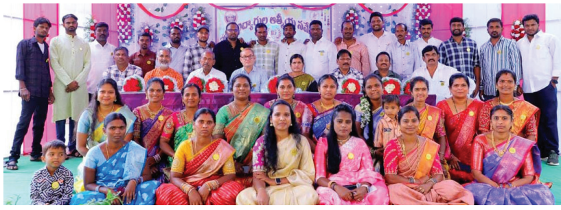
అందించాలని పూర్వ విద్యార్థులకు సూచించారు. ఉదయం నుండి సాయంత్రం వరకు తమ చిన్ననాటి జ్ఞాపకాలను గుర్తుచేసుకొని, ఒకరినొకరు ఆత్మీయంగా పలకరించుకున్నారు. ఈ ఆత్మీయత సమ్మేళనంలో చిన్ననాటి మిత్రులు చాలా సంవత్సరాల తర్వాత ఒకే వేదికపై కలుసుకోవడంతో అప్పటి మధుర జ్ఞాపకాలను