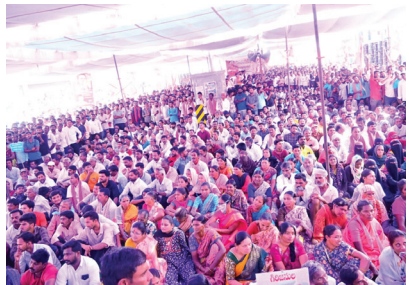
ది. వాటిని అమలు చేశారా? మొన్న అధికారులు పోతే ప్రజలు నిరసన తెలిపారు. కానీ రేవంత్ రెడ్డి పోయి ఉంటే

ఉరికించి, ఉరికించి కొట్టేవారు. ఢిల్లీలో రైతులు ఏదాది పాటు అందోళన చేసి మోదీ లాంటి వ్యక్తినే నల్ల చట్టాల నుంచి వెనక్కి తగ్గేలా చేశారు. రైతుల పవర్ అంటే అలా ఉంటుంది. రైతులతో పెట్టుకున్న ఈ రేవంత్ రెడ్డికి తప్పకుండా బుద్ధి చెప్పే సమయం వస్తుంది. రేవంత్ రెడ్డి ప్రభుత్వాన్ని కూకటి వేళ్లతో పెకిలింపే దాకా పదిలిపెట్టమని చెబుతున్నా. రేవంత్ రెడ్డి వచ్చాక రైతుబంధు ఎగ్గొంట్లొండు. ఫించన్ పెంచలేదు. బోనస్ బోగస్ అయ్యింది. ఆడ బిడ్డలకు మహాలక్ష్మీ స్కీం వచ్చిందా? మహారాష్ట్రకు పోయి కూడా ఆడబిడ్డలను మోసం చేసే ప్రయత్నం చేస్తే అక్కడి ఆడబిడ్డలు బుద్ధి చెప్పారు' అని కేటీఆర్ మండిపడ్డారు.