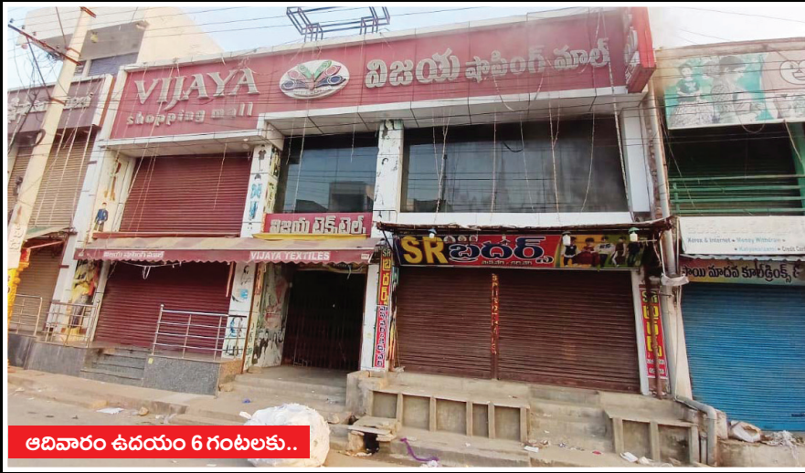
అదివారం ఉదయం 6 గంటలకు..