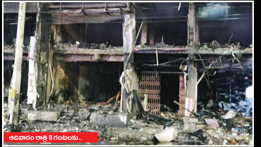
అదివారం రాత్రి 8 గంటలకు..