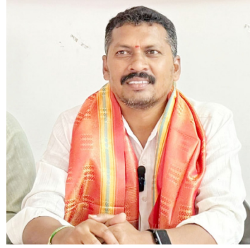
అయినా డిజిటల్ మీడియా ద్వారానే ప్రజలకు ముందుగా చేరుతోందన్నారు. ఈ తరుణం ప్రధాన పత్రికలు, ఎలక్ట్రానిక్ మీడియా సంస్థలు