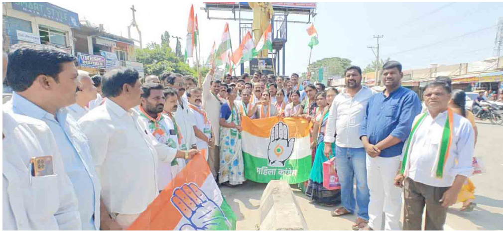
జనగామ అంబేద్కర్ సెంటర్ లో నిరసన తెలుపుతున్న కొమ్మూరి వర్గీయులు