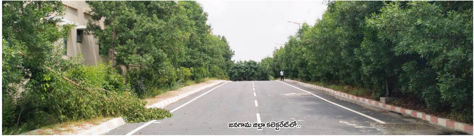
జనగామ జిల్లా కలెక్టరేట్లో..

ఇది సిద్దిపేట జిల్లాలోని మద్దురు మండలం.. ఇక్కడ కూడా 'కోనో కార్పస్' మొక్కలను విరివిగా నాటారు. గ్రామానికి వెళ్లే దారిలో రోడ్డుకు ఇరువైపులా ఈ మొక్కలను చూస్తూ జనాలు భయందోళన చెందుతున్నారు. ప్రధాన దారిలో ఉన్న వ్యాపారులు, ప్రజలు ఈ మొక్కలను తొలగించాలని పంచాయతీ అధికారులకు విన్నవించినా రేపు మాపు అని కాలం వెళ్లబిస్తున్నారని వాపోయారు.