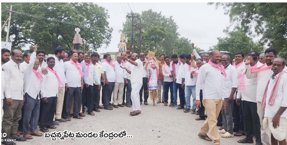
బచ్చన్నపేట మండల కేంద్రంలో...