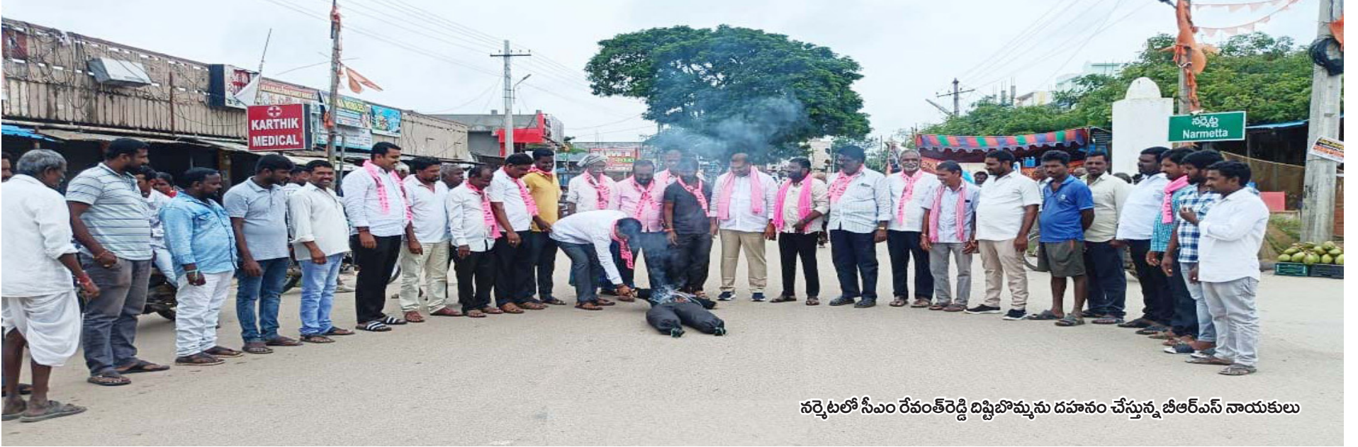
నర్సేట్లో సీఎం రేవంత్ రెడ్డి దిష్టిబొమ్మను దహనం చేస్తున్న బీఆర్ఎస్ నాయకులు