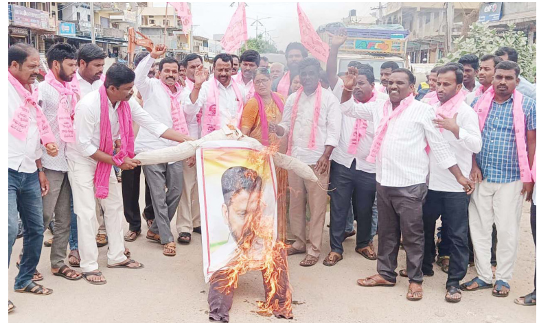
చేర్యాల మండల కేంద్రంలో...