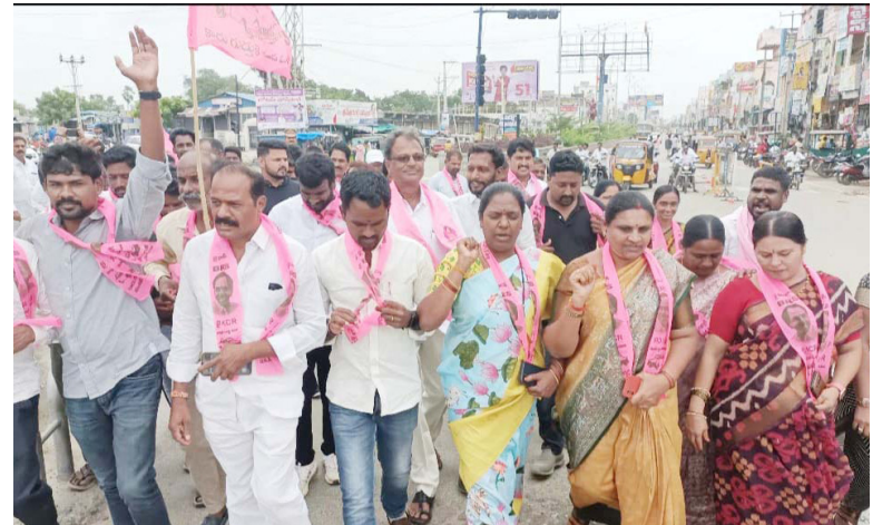
జనగామ జిల్లా కేంద్రంలో బీఆర్ఎస్ నేతల ర్యాలీ

మన చౌరాస్తా, నెట్ వర్క్ : బీఆర్ఎస్ మహిళా ఎమ్మెల్యేలు సబితా ఇంద్రారెడ్డి, సునీత లక్ష్మారెడ్డిపై సీఎం రేవంత్ రెడ్డి అనుచిత వ్యాఖ్యలు చేశారని ఆరోపిస్తూ బీఆర్ఎస్ రాష్ట్ర వ్యాప్తంగా నిరసన చేపట్టింది. ఆందోళనలో భాగంగా బచ్చన్నపేట, నర్సేట్, తరిగొప్పల, దూళ్లట్ల, చేర్యాల, మద్దూరులో సీఎం రేవంత్ రెడ్డి దిష్టిబొమ్మలను దహనం చేశారు. రేవంత్ రెడ్డి, రాష్ట్ర ప్రభుత్వానికి వ్యతిరేకంగా నినాదాలు చేస్తూ ర్యాలీలు నిర్వహించారు. ఇక జనగామలో నిర్వహించిన ఆందోళనలో ఉల్లిక పరిస్థితులు నెలకొన్నాయి. బీఆర్ఎస్ నేతలు సీఎం దిష్టిబొమ్మ దహనం చేసేందుకు యత్నించి పోలీసులు అడ్డుకుని భగ్నం చేశారు. దీంతో ఇరు వర్గాల మధ్య తోపులాట జరిగి పలువురికి స్వల్ప గాయాలయ్యాయి.