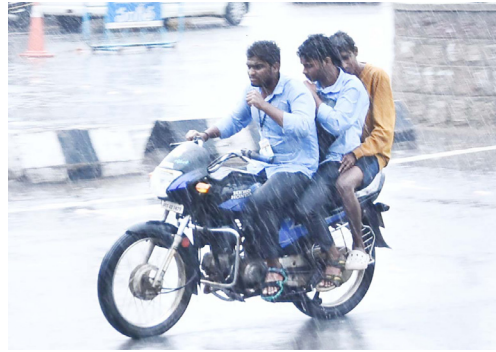
అబ్దుల్ నాగారంలో 4.5 మి.మీ, జనగామ మండలం వద్దకొండలో 4 మి.మీ, పాలకుర్తి మండలం వాలిలాలలో 2 మి.మీ, స్టేషన్ ఫున్ పూర్ లో 1.3 మి.మీ, చిల్వూర్ మండలం మలక్కాపూర్ లో ఒక మిల్లీమీటర్ వర్షపాతం నమోదైంది.

మన చౌరాస్తా, జనగామ ప్రతినీధి : 'వానోచ్చెనంటే వరదొస్తది..' అన్నట్టు తయారైంది జిల్లా కేంద్రమైన జనగామ పరిస్థితి. గురువారం కురిసిన చిన్న పాటి వర్షానికేని పట్టణంలో ప్రధాన రహదారులు జలమయమయ్యాయి. పట్టణంలోని హైదరాబాద్-హనుమకొండ రోడ్డుపై మురుగు నీరు ఏరులై పారింది. దీంతో ప్రయాణికులు, వ్యాపారస్తులు తీవ్ర ఇబ్బంది పడ్డారు. జిల్లా వ్యాప్తంగా గురువారం ఉదయం 8 నుంచి సాయంత్రం 6 గంట వరకు కురిసిన వర్షపాతం ఈ విధంగా ఉంది. జిల్లాలోని లింగాలఘణపురం మండలంలో అత్యధికంగా 8 మిల్లీమీటర్ల వర్షం కురిసింది. నర్సెట్ల 5 మి.మీ, తరిగొప్పుల మండలం