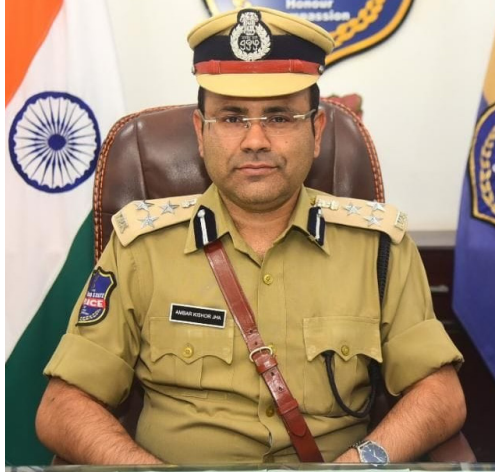
రులకు, సిబ్బందికి సహకరించాలని కోరారు. ఎవరైనా ఈ నియమ నిబంధనలను పాటించకుండా ఇబ్బందులకు గురిచేస్తే అట్టివారిపైన చట్టపరమైన చర్యలు తీసుకుంటామని సీపీ హెచ్చరించారు.

వరంగల్, మన చౌరాస్తా : ఈ నెల 27వ తారీఖున నల్లగొండ, వరంగల్ ఖమ్మం పట్టణాదుల ఎమ్మెల్సీ ఎన్నికల సందర్భంగా వరంగల్ పోలీస్ కమిషనరేట్ పరిధిలో (వరంగల్, హనుమకొండ, జనగామ) 144 సెక్షన్ల అమలు చేస్తున్నట్లుగా వరంగల్ పోలీస్ కమిషనర్ అంబర్ కిషోర్ ఝా ఓ ప్రకటనలో తెలియజేశారు. వరంగల్ ఖమ్మం పట్టణాదుల ఎమ్మెల్సీ ఎన్నికలను వరంగల్ పోలీస్ కమిషనరేట్ పరిధిలో ఎలాంటి అవాంఛనీయమైన సంఘటనలు జరగకుండా ఎన్నికలను ప్రశాంతంగా నిర్వహించేందుకు గాను ఈ నెల 27 తేదీ ఉదయం 6 గంటల నుండి రాత్రి 8 గంటల వరకు 144 సెక్షన్ల అమలులో ఉంటుందన్నారు. ఈ సందర్భంగా వరంగల్ పోలీస్ కమిషనరేట్ పరిధిలో బహిరంగ సభలు, ర్యాలీలు నిషేధం ఉంటుందని. ఎన్నికల వేళ పోలింగ్ కేంద్రాల చుట్టూ గుమిగూడరాదన్నారు. పోలింగ్ కేంద్రం నుండి 200 మీటర్ల హద్దును దాటి ఓటర్లు తప్ప ఎవ్వరు లోపలికి రాకూడదని సూచించారు. కావున కమిషనరేట్ పరిధిలోని ప్రజలు ఇట్టి విషయం పైన దృష్టి సారించి పోలీస్ అధికారి