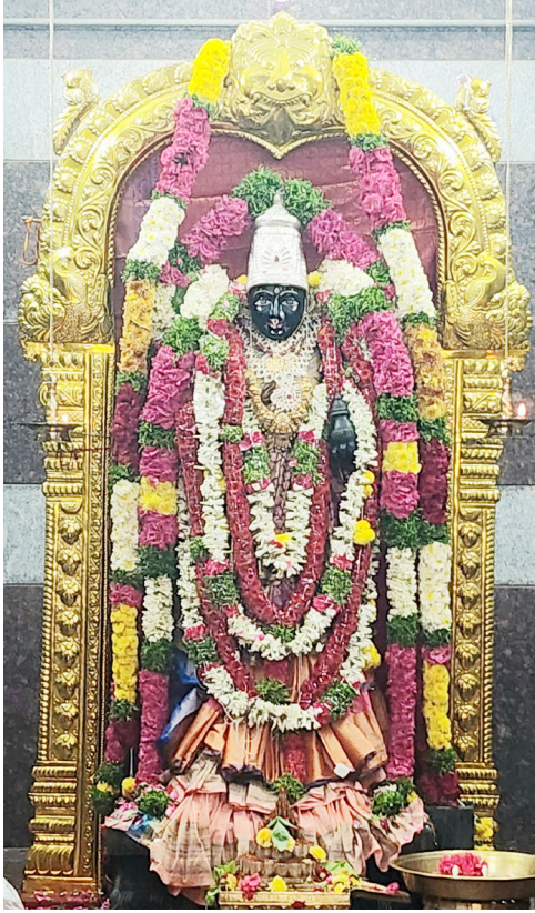
వాసవీ కన్యకాపరమేశ్వరి మాత జయంతి సందర్భంగా ప్రత్యేక అలంకరణలో అమ్మవారు