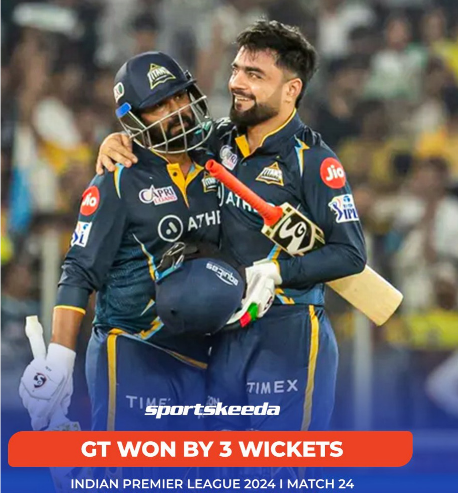
GT WON BY 3 WICKETS INDIAN PREMIER LEAGUE 2024 | MATCH 24

ఈ సీజన్ లో రాజస్థాన్ వరుసగా నాలుగు విజయాలు సాధించింది. జోరుమీద కనబడింది. ప్రత్యర్థి ఎవరైనా విజయం మాడే అన్నట్టుగా సంజు శాంసన్ సేన దూసుకుపోయింది. అయితే గెలుపు కిక్కులో ఉన్న ఆర్ ఆర్ కు ఓటమి రుచి చూపించింది గుజరాత్. భారీ లక్ష్యం ముందున్నా.. చేయాల్సిన రన్ రేట్ పెరిగిపోతున్నా బెదరలేదు. ఆఖరి వరకు పోరాడింది. ఆఖరి బంతికి ఫోర్ కొట్టి గెలిచింది. ఈ గెలుపు క్రెడిట్ రషీద్ ఖాన్, తెవాటియా కు దక్కుతుంది అనడంలో ఎలాంటి అతిశయోక్తి లేదు. ప్రజల్లో చక్కటి షేన్ మెంట్ తో పరుగులు రాబట్టారు. ముఖ్యంగా రషీద్ ఖాన్ ఆఖరి బంతికి కొట్టిన ఫోర్ అదిరిపోయింది.